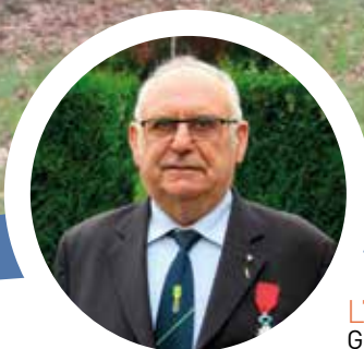
L'ÉCHO ZOOM P. 11 Guillaume GLORO