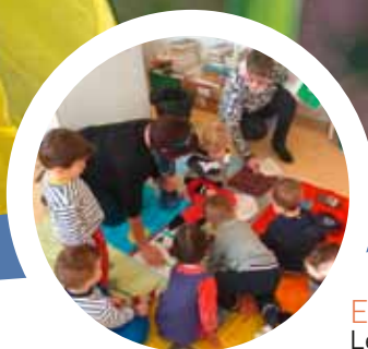
ECHO ENFANCE JEUNESSE P. 8 Le tapis lecture à la bibliothèque