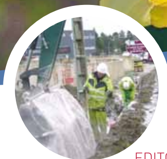
EDITO P. 2 Travaux rue de la Gaieté